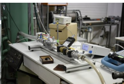
Stano­wisko do wzorcowania dysz Venturiego o przepływie krytycznym