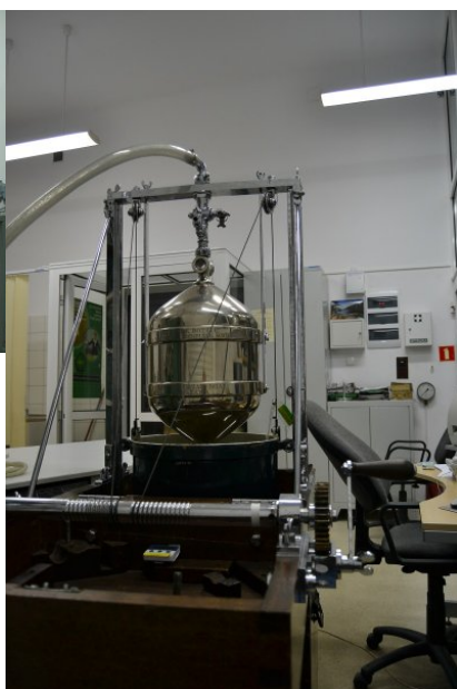
Kolba pomiarowa o objętości nominalnej 25 dm 3