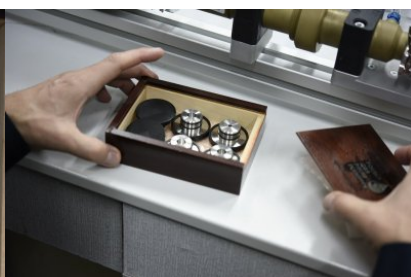
Pudełko z dyszami Venturiego o przepływie krytycznym