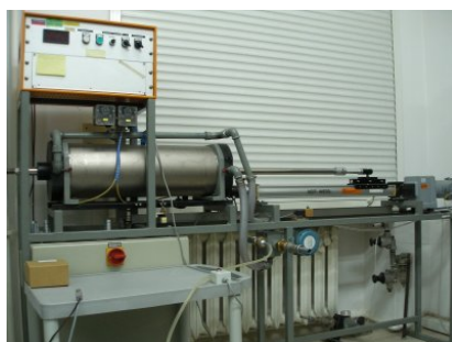
Stano­wisko pomiarowe z wzorcem tło­kowym

Autor : Arkadiusz Zadworny Opublikowane przez : Adam Żeberkiewicz