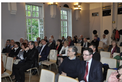
Goście spotkania w Centrum Prasowym Foksal

Autor : Adam Żeberkiewicz Opublikowane przez : Adam Żeberkiewicz