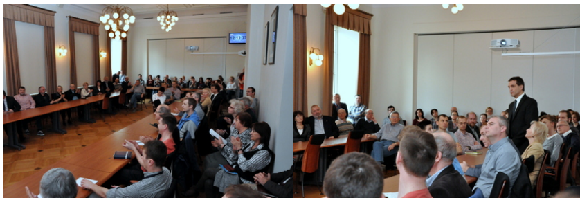
Seminarium w GUM 5.04.2016