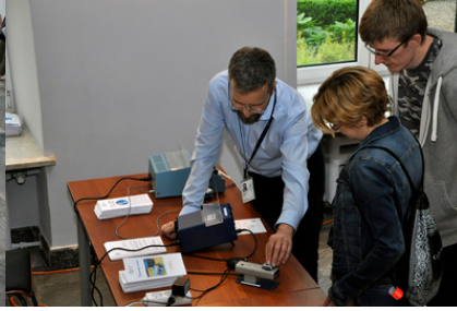
Stoisko Laboratorium Czasu i Częstotliwości