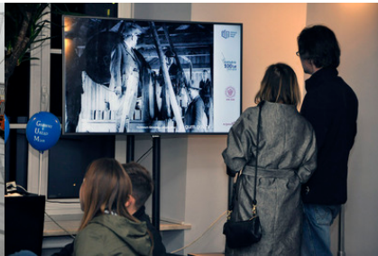
Na monitorze: slajdy pokazujące historię GUM