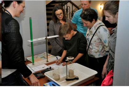
Stoisko pomiaru lepkości