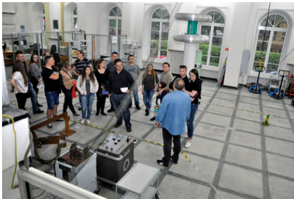
W Hali Wysokich Napięć Laboratorium Elektryczności i Magnetyzmu