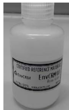
Rys. 2. Kandydat EnvCRM 02 zawierający śladowe ilości Cd, Ni, Pb, As i Se w matrycy wód rzecznych

Jednym z istotnych etapów projektu EMPIR 14RPT03 ENVCRM jest proces certyfikacji wytworzonych