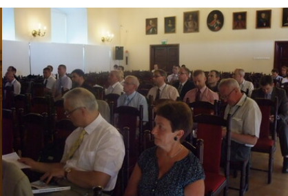
Podczas obrad Kongresu