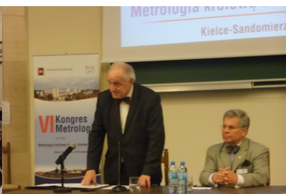
Przewodniczący Kongresu, Rektor