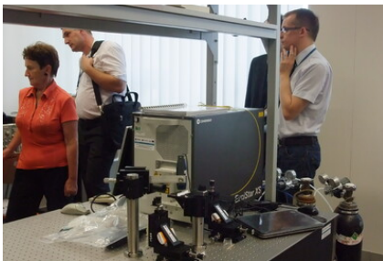
Zwiedzanie Laboratorium Zakładu Elektrycznego Politechniki Świętokrzyskiej