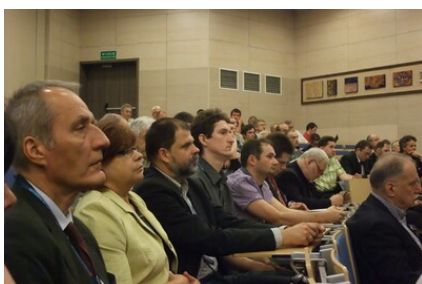
Przedstawiciele GUM podczas obrad