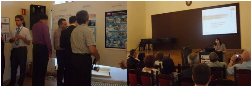
Sesja plakatowa podczas Kongresu